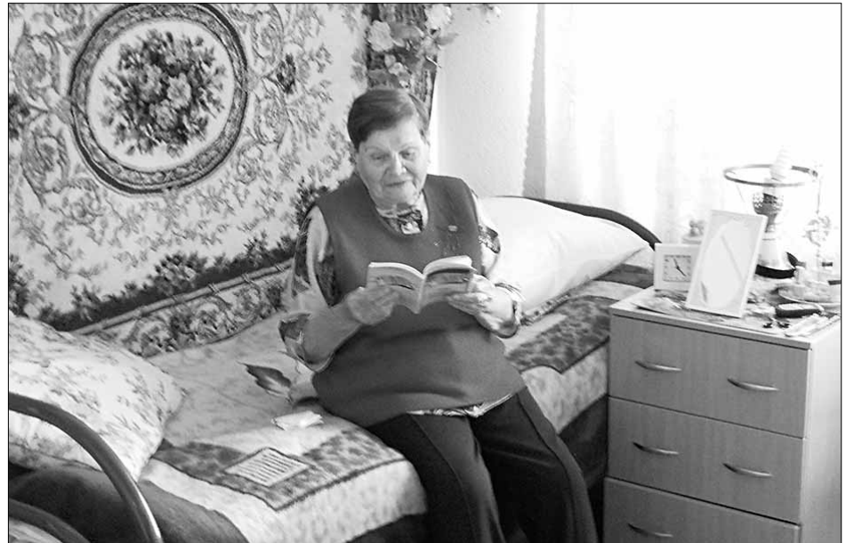
В комнатах дома престарелых светло и уютно